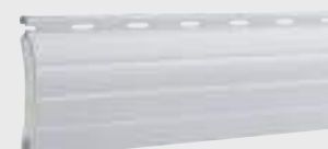
Aluminium double paroi (90 kg/m 3 )