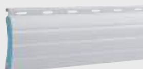
Aluminium double paroi (350 kg/m 3 )