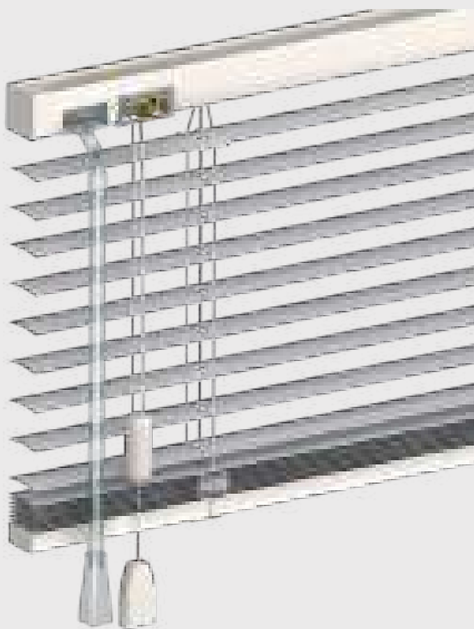
Manœuvre cordon et tige