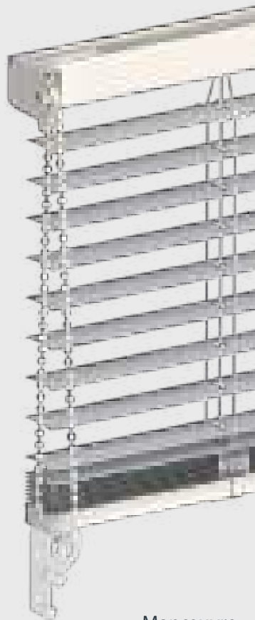
Manœuvre monocommande chaînette