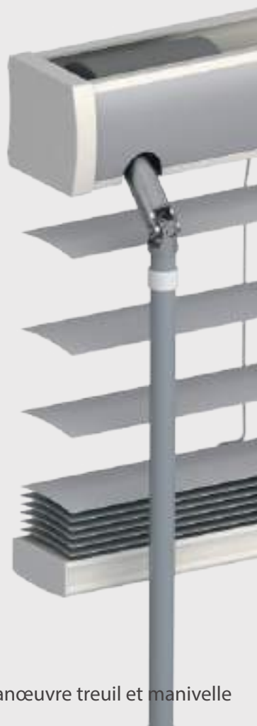
Manœuvre treuil et manivelle