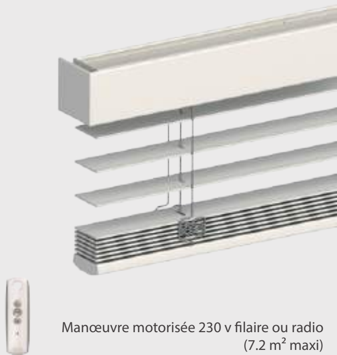
Manœuvre motorisée 230 v filaire ou radio (7.2 m 2 maxi)