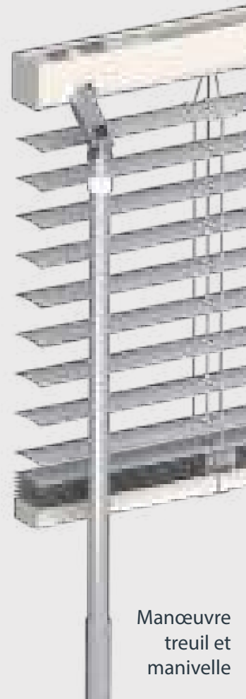
Manœuvre treuil et manivelle