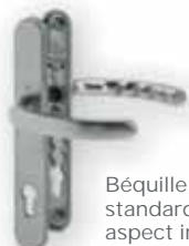
Béquille standard aspect inox